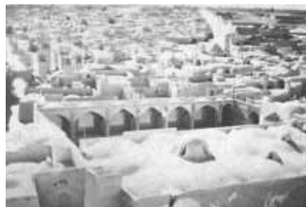
شکل 3-محمدیه (شهرکی نزدیک نایین) - فضای باز و یک جبهه از یک میدان محله‌ای طراحی شده.

این میدان‌ها در مرکز محله‌ها قرار داشتند و به دو شکل راسته و گذرگاه و یا به صورت میدانچه در محل تقاطع چند راه یا در کنار راه بودند.