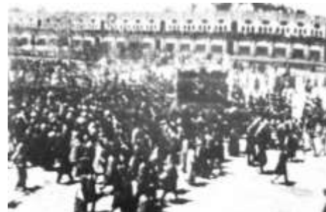
شکل 6-تهران - میدان توپخانه در هنگام تشییع جنازه ی ناصرالدین شاه / اصفهان - میدان امام. فضاهای پیرامون میدان متناسب با خصوصیات میدان ساخته شده اند و به آن وابسته هستند.