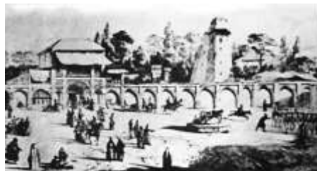
شکل 2-تهران - میدان ارگ در هنگامی که کارکرد یک میدان حکومتی و نیمه عمومی داشت. (منبع: کتاب فضاهای شهری)

بیشتر برای تمرین‌های نظامی، سان و رژه ارتش و یا مجازات مجرمان استفاده می‌شد. معمولا در پایتخت‌ها و شهرهای بزرگ یک میدان حکومتی وجود داشت که برای تمرین‌های نظامی، سان و رژه و انجام مراسم رسمی و احیانا مجازات مجرمان مورد استفاده قرار می‌گرفت. در بعضی موارد، این گونه میدان‌ها تنها جنبه‌ی حکومتی و سلطنتی داشتند و فعالیت‌های مهم و عمده‌ی دیگری در آنجا انجام نمی‌شد، مانند میدان ارگ تهران در پیش از تغییرات کارکردی و کالبدی آن. در پیرامون این میدان‌ها، بناهای نظامی، حکومتی و سلطنتی قرار داشتند، اما در مواردی شخص حاکم یا تشکیلات حکومتی، در هنگام ساختن یا بازسازی چنین میدانی، آن را به گونه‌ای طراحی می‌کردند و در منطقه‌ای مستقر می‌نمودند که میدان دارای کارکردهای اجتماعی نیز باشد. میدان نقش جهان (امام) اصفهان، یکی از نمونه‌های خوب این گونه میدان‌هاست.