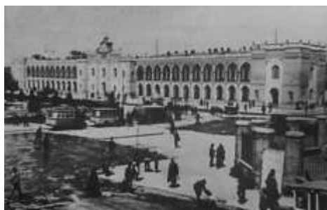
شکل 1-تهران-میدان امام (توپخانه) پس از آن که به یک میدان عمومی تبدیل شد. در این تصویر ساختمان شهرداری که در ضلع شمالی میدان قرار داشت دیده می‌شود.

این میدان‌ها محل تجمع مردم بود، به همین دلیل در این میداين فضاهای عمومی چون: عبادتگاه و مساجد، نهرآب، آب انبار، فضاهای تجاری، بازار، حمام و مدرسه ساخته می‌شد.