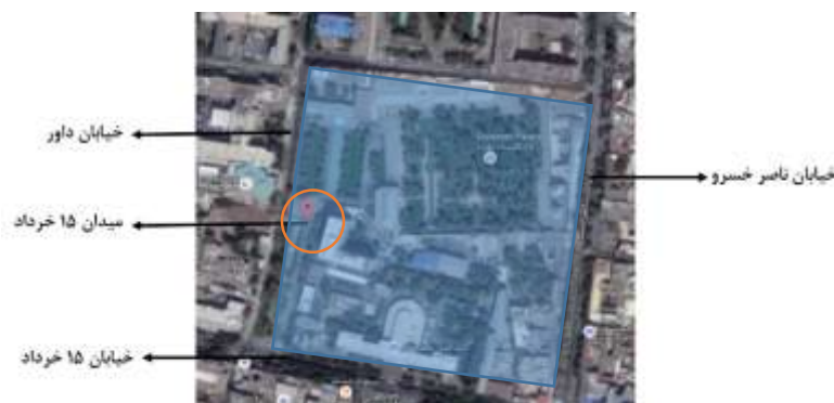
شکل 8-تصویر گوگل

ارگ حکومتی تهران در زمان ناصرالدین شاه، شامل محوطه ای بود که امروزه محدوده بین ضلع جنوبی میدان توپخانه (امام خمینی کنونی) و قسمتی از خیابان سپه یا مریضخانه (امام خمینی کنونی)، بخشی از خیابان جباخانه یا بوذرجمهری (پانزده خرداد کنونی) تا چهارراه گلوبندک، خیابان ناصریه (ناصر خسرو کنونی) و خیابان جلیل آباد (خیام کنونی) از گلوبندک تا خیابان سپه یا مریضخانه (امام خمینی کنونی) را در بر می گرفت.