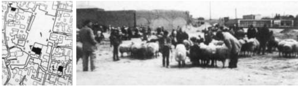
شکل 7-نیشابور- میدان گوسفندفروشها. چند بنای مستقل از میدان، آن را محصور کرده اند. / آران - نمونه ی یک میدان جانبی مستقل از میدان (1.میدان 2.مسجد 3.حسینیه کوچک 4.حسینیه سلیمانی)