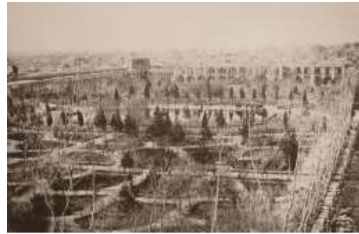
شکل 12- دارالفنون نخستین مدرسه علوم جدید، در این محل تاسیس و نخستین پارک عمومی تهران نیز در این محدوده ساخته شد.