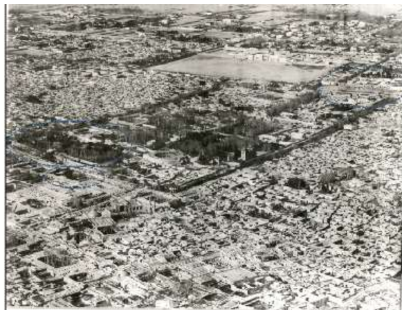
شکل 11- عکس هوایی شهر تهران پس از گسترش آن در زمان ناصر الدین شاه سبزه میدان و میدان ارگ در سمت چپ و میدان توپخانه در سمت راست عکس است منبع ماخذ: خانه کاخ گلستان