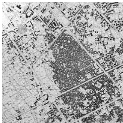
شکل 5-سمنان - بازار در امتداد راه منتهی به مسجد بزرگ در کنار یک میدان قرار دارد.

بررسی برخی از خصوصیات میدان‌ها در این نوشتار به سبب کارکرد ارتباطی آنها به عنوان یک مفصل ارتباطی و شهری انجام می‌گیرد، اما همان گونه که بازارها در کنار کارکرد ارتباطی، دارای کارکردهای اقتصادی، اجتماعی و فرهنگی نیز بودند، بیشتر میدان‌ها هم در کنار کارکرد و نقش ارتباطی، زمینه و فضایی برای انجام بعضی از فعالیت‌های مهم اجتماعی و شهری بودند، که این امر نظم هندسی را در بافت میدان ایجاد می‌کرد.