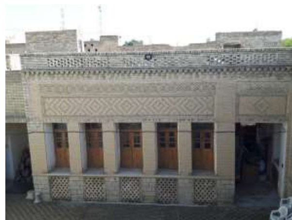
تصویر شماره (3) حیاط (بعد از هشتی)، منبع: نگارنده تصویر شماره (4) پنج دری خانه محسنی منبع: نگارنده