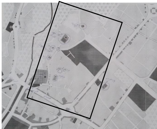
محله پاچمن شهر صحنه

در زمینه تاریخ پیدایش، شکل‌گیری و مراحل تاریخی توسعه شهر صحنه، اطلاعات مستند، بسیار اندک و ناچیز است. و هیچ گزارش باستان‌شناسانه‌ای در مورد بافت شهری در دسترس نیست. از نقطه نظر بافت شهری، قدیمی‌ترین محله شهر صحنه محله پاچمن می‌باشد که قدمت آن از لحاظ تاریخی دقیقاً مشخص نمی‌باشد اما در سفرنامه شاه عباس از روستای صحنه به عنوان روستایی سبز و آباد نام برده شده است و با توجه به برداشت محلی توسط نگارنده بافت این محله کاملاً ارگانیک و سنتی بوده که تنها با مصالح نسبتاً امروزی مرمت گردیده است. محله پاچمن طبق شکل زیر از شمال در پای کوه و از غرب همسایه باغات آباد و سراب صحنه و از ضلع شرق و جنوب همسایه واحدهای مسکونی می‌باشد.