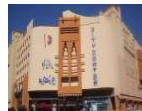
شکل 4- بازار سیتی سنتر