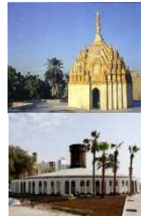
شکل 1- معبد هندوها