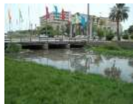
شکل 5- خور گورسوزان