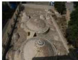
شکل 3 - کتابخانه شهدا

نتایج به دست آمده در حالیست که عناصر شاخص در شهر بندرعباس توسط نگارندگان و براساس معیارهای نزدیک به استاندارد انتخاب شده و تعدادی از قوی‌ترین آن‌ها به عنوان گزینه در اختیار پاسخ‌دهندگان قرار گرفت که از میان گزینه‌های موجود (حمام گله‌داری، کتابخانه شهدا، معبد هندو ها، بازار سیتی سنتر و خور گورسوزان) بیشترین آرا مربوط به معبد هندوها می باشد.