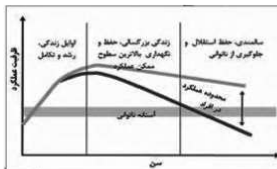
شکل 1- مآخذ بررسی کیفیت فضای جمعی با رویکرد سالمندان