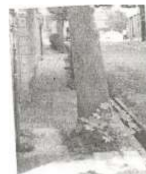
شکل 2- پیاده رو با عرض نامناسب