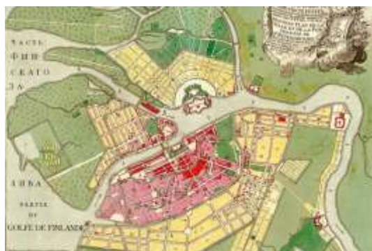
شکل 2: پلان شهر سن پترزبورگ الهام گرفته از باغ ورسای

ایده های باروک بر پلان خیابان ها و حومه برخی از شهرها تاثیر گذاشت. در فراسکاتی در خارج از رم؛ در ورسای در خارج از پاریس؛ در پوتسدام خارج برلین؛ در همپتون در خارج از لندن؛ در پترهوف خارج از سنت پترزبورگ. دوره اولیه باروک در ایتالیا اتفاق افتاد، اوج این دوره در فرانسه و دوره متاخر آن در سراسر اروپا با لحجه های مختلف به وجود آمد. همچنین این سبک تاثیر زیادی بر شهرهای سرمایه دار مثل رم، پاریس، برلین و واشنگتن دی سی و همچنین استراحتگاه هایی مثل ورسای، پوتسدام، سن پترزبورگ و آرانجوز گذاشت.