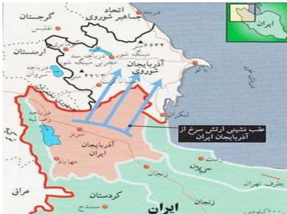
شکل 2- نقشه ژئوپلیتیک عقب نشینی ارتش سرخ از آذربایجان (مأخذ: فرمانداری بندر آستارا)