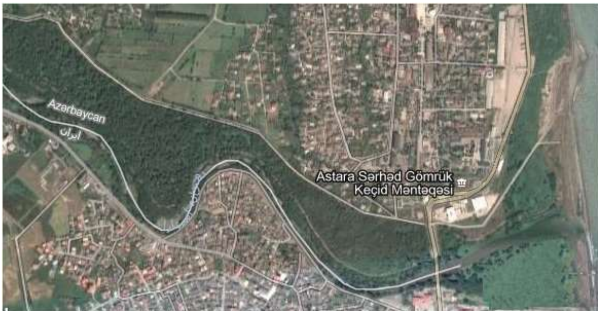
شکل 3- نقشه هوایی از مرز سیاسی ایران و آذربایجان بین آستارای ایران و آستارای کشور آذربایجان

در حالی که به نظر می رسد مرزهای دسته بندی شده بالا از سوی هارتشون از منطق محکم جغرافیایی و سیاسی بهره چندانی نداشته باشند، مرزهای طبیعی، فرهنگی، سیاسی، قومی و تحمیلی در جهان حقیقی واقعیت و وجود دارند. دکتر دره میرحیدر نیز مرزها را از دو جهت تقسیم بندی کرده است: یکی از جهت چگونگی پدید آمدن و درجه تطبیق آنها با پراکندگی گروه های قومی، زبانی و دیگری از جهت تطبیق یا عدم تطبیق با عوارض طبیعی، اگر از نگاه اول به مرزها بنگریم چهار نوع مرز خواهیم داشت: