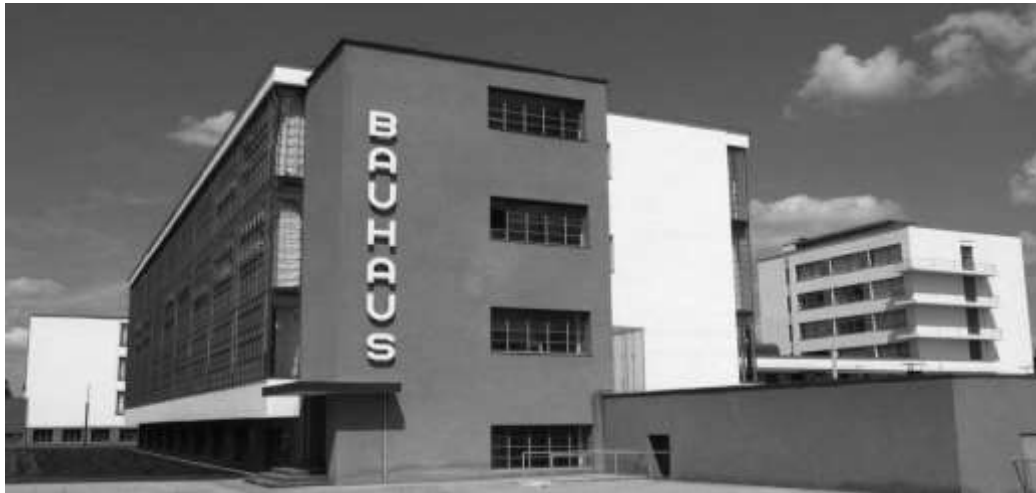
تصویر 2 - گروپیوس، مدرسه باوهاوس، دساو