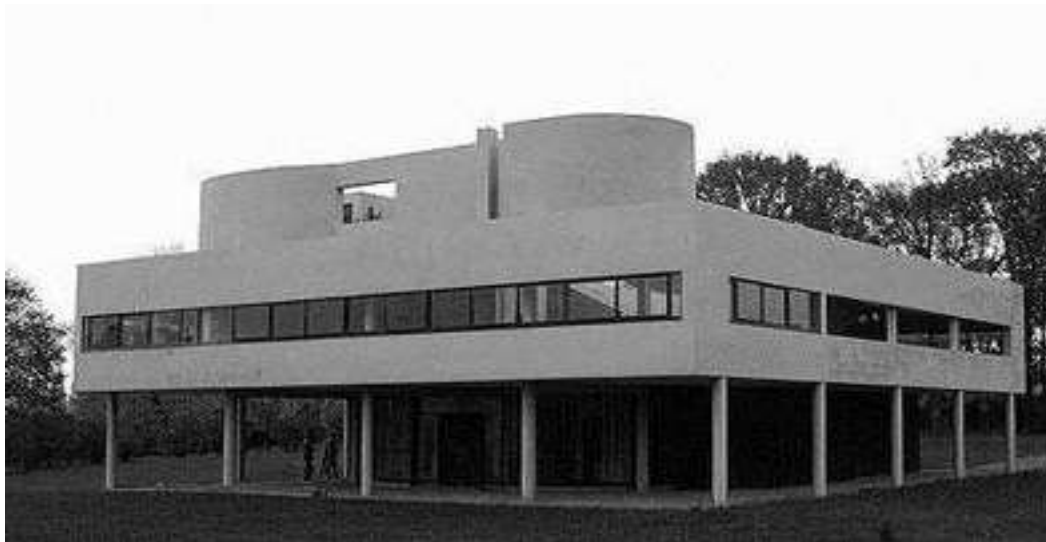
تصویر 3- لوکوربوزیه، ویلا ساوا، پواسی

ویلا ساوا کاملترین اثری بود که اصول و عقاید کوربو آن را بوسیله سیمان و شیشه به مرحله تحقق در آورد و او را از مرحله جوانان انقلابی به مرحله استادان با تجربه سوق داد. (تصویر-3) ویلا ساوا از زمین جدا شده و با شکل هندسی خود بسوی آسمان میروید درست مانند اینکه یک غول دستش را به هوا بلند کرده باشد. ویلا ساوا ساختمانی بتن آرمه ای با روکش سفید صاف از مواد تمام کننده است. داخل و خارج همه سفید بودند، سفیدی که در زیر نور آفتاب ارزش پلاستیکی بالائی را به خود میگریفت؛ اما بعضی اوقات به روی دیوارها و پارتیشن ها اشاره ای از رنگ نیز دیده میشود. [18]