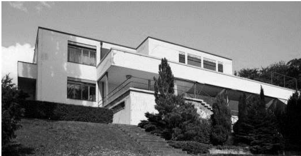
تصویر 4 - میس و ندرروهه، خانه توگندهات، برنو

جزئیاتش بی هیچ محدودیتی از جانب کارفرما محقق سازد. [19] تناقضهای ذاتی و جدا نشدنی تصور میس و ندرروهه، از معماری مسکونی بالاخص در این مورد بسیار تجملی، مشهود است. [9] (تصویر-4) در قضاوت مارکسیست های هوادار معماری مدرن، هیچ اثری از شور و شوق نسبت به بنای این خانه دیده نشد. آنها برا این باور بودند که خانه ی توگندهات به اصول مدرنیسم خیانت کرده است و مطابق معمول بر صرفه جویی در بودجه و مقیاس تأکید می کردند. [19]