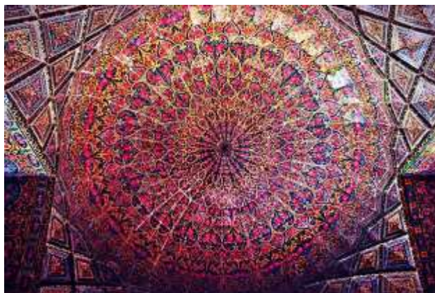
تصویر شماره 14 کاشی های صورتی مسجد نصیر الملک-شیراز

مسجد به مسجد صورتی معروف است. چرا که از این رنگ استفاده‌ی بسیاری در کاشی‌های داخلی مسجد شده است. اگر چه با وجود تنوع رنگی بسیار، دور از انصاف است که تنها از این رنگ یاد شود. شیشه‌های رنگی در ساختار مسجد لطف و شکوه خاصی به بنا داده است. از طرفی نادر بودن چنین معماری‌ای بر ارزش زیبایی و عظمت این مسجد افزوده است. ۲۲