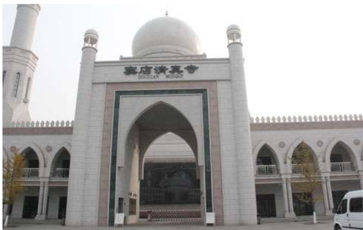
تصویر شماره 6-مسجد دو دیان در پکن

مسجد ردی از معماری یونانی دیده می شود در حالی که گنبدها و گلدسته به روش مساجد عربستان سعودی ساخته شده اند. روی درهای فلزی و مسی رنگ هم نقش و نگارهایی از الگوهای غربی دیده می شود. این مسجد از فرهنگ باستانی چین نیز بی بهره نبوده و در ورودی صحن اصلی گلدان های بزرگی برای سوزاندن عود و خوشبو کردن فضا ساخته شده است. ۱۰