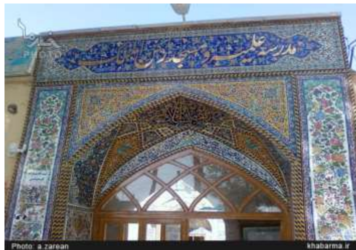
تصویر شماره 11-مدرسه و مسجد رکن الملک در اصفهان

بر هلال سردر اشعاری با خط نستعلیق سفید بر زمینه کاشی خست لاجوردی رنگ نوشته شده است. ۱۷