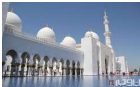
تصویر شماره 3- مسجد سفید

از جمله مساجد معروف جهان اسلام که بناب آن به طور غالب به رنگ سفید است می توان به مسجد الشیخ زاید بن سلطان آل نهیان که در ابوظبی قرار دارد اشاره کرد. این مسجد، بعد از مسجد النبی و مسجد الحرام، سومین مسجد بزرگ جهان است. گنبد مسجد، بزرگترین گنبد جهان است و ارتفاع آن حدود 83 متر و وزن آن هزار تن است. تمام مسجد از سنگ سفید پوشیده شده است. 8