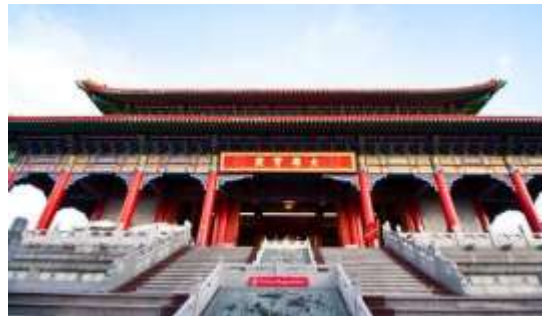
تصویر شماره 13- معبد لاما-چین

معبد لاما یکی از بزرگترین و بهترین معابد حفظ شده در شهر پکن و از جاذبه های گردشگری چین می باشد. این معبد در ابتدا محل سکونت پادشاه آن دوره بوده ولی چندسال بعد به طور کلی تغییر کاربری داده است و به معبد تبدیل شده است. این معبد با کاشی های لعاب دار زرد رنگ و سقفی قرمز با کاشی های نفیس تزیین شده است. 21