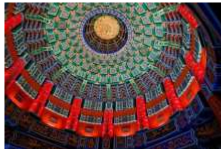
تصویر شماره 19- معبد بهشت

معبد بهشت یا همان معبد تیان تان جز یکی از ده معبد شگفت انگیز جهان به حساب می آید. این معبد محل عبادت امپراتوران مینگ و کونینگ بوده و این پادشاهان خود را پسر بهشت یا تیان زی می نامیدند. به همین دلیل جرات نمیکردند محل اقامت خود یعنی شهر ممنوعه را بزرگتر از اقامتگاه خدا بسازند. در کاشی کاری های سقف این معبد از رنگ سبز و قرمز به وضوح استفاده شده است. گنبد آسمان پادشاهی یک ساختمان دایره ای کوچک تر است که بدون استفاده از الوار ساخته شده و گنبد زیبایی دارد. محراب مدور دارای سه لایه تراس سنگی سفید است که توسط دو مجموعه دیوار مربعی در خارج و دیواری دایره ای شکل در داخل احاطه شده که نمادی از زمین مربع و آسمان اطراف آن است. 27