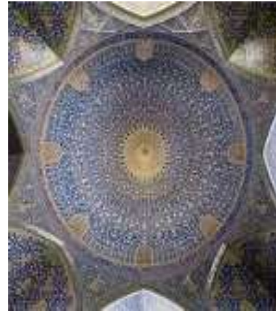
تصویر شماره 8- نمونه کاشی کاری تصویر شماره 9- نمای بیرونی