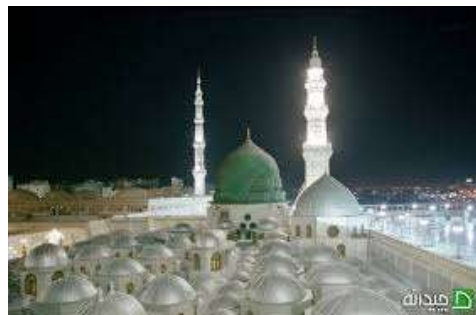
تصویر شماره 20- مسجد النبی

گنبد سبز رنگ این مسجد یکی از نمونه های زیبایی است که میتوان نام برد. 28