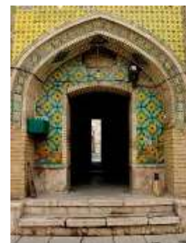
تصویر شماره 16-مسجد خانم تصویر شماره 17-نمونه ی کاشی کاری مسجد خانم