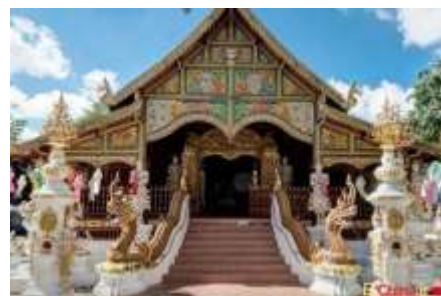
تصویر شماره 18-معبد مینگ پکن

این معبد که در منطقه ی چانگ پینگ در شمال غربی شهر پکن قرار دارد،به بهترین معبد جهان تبدیل شده است.نمای اصلی این معبد با کاشی های لعاب دار طلایی تزئین شده است. 26