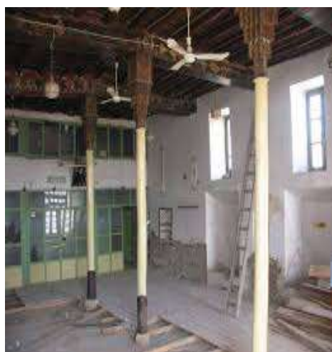
تصویر شماره 5-مسجد سفید مراغه

این مسجد در بخش مرکزی شهرستان مراغه در داخل بافت تاریخی و فرهنگی شهر مراغه و در خیابان تازه احداث جام جم قرار دارد. قدمت این بنا بر اساس کتیبه ی مرمری که در سر در آن قرار دارد، مربوط به دوره ی شاه طهماسب صفوی میشود. پلان این مسجد مستطیل شکل است که عرض آن دو برابر طول آن می باشد و دارای سه ستون چوبی مقرنس کاری شده با پایه ستون های سنگی و سقف نقاشی شده می باشد. به نظر میرسد این بنا به دلیل وجود سنگ سفید مرمری سردر آن به این اسم نام گذاری شده است. 9