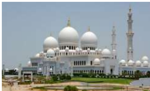
تصویر شماره 2- مسجد سفید