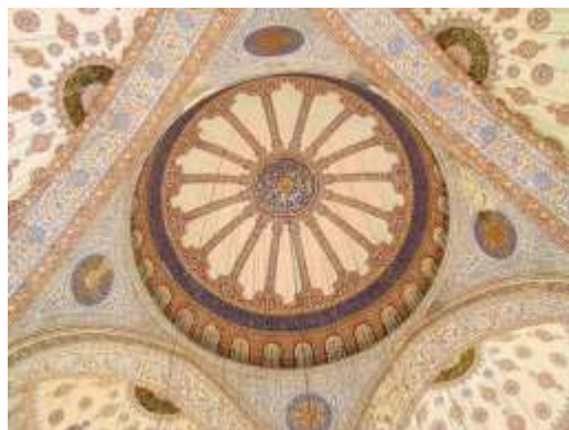
تصویر شماره 7-نمونه ی کاشی های داخلی مسجد آبی

فکر و اندیشه می‌گردد. اگر آبی شکلی دایره ای داشته باشد نیز سبب ذخیره و گردآوری نیروها در مرکز خود و تقویت نیروی دورگیری می‌شود. (حبیب الله - آیت الهی - 1376-ص 154) از مساجدی که در آنها از رنگ آبی استفاده شده است می‌توان مسجد سلطان احمد در استانبول را نام برد. این مسجد که در شهر استانبول قرار دارد، یکی از شاهکارهای معماری اسلامی است که به دلیل استفاده از کاشی‌های آبی رنگ در طراحی داخلی به مسجد آبی نیز شهرت دارد. دور تا دور صحن مسجد در پایین‌ترین قسمت توسط ۲۰۰۰۰ کاشی سرامیک دست ساز تزیین شده است که این سرامیک‌ها در از نیک (نیشای باستان) ساخته شده‌اند. بخش بالایی نقاشی شده است. بیش از ۲۰۰ پنجره شیشه‌ای نور را به درون صحن اصلی هدایت می‌کنند و از لوسترهای بزرگ نیز برای نورپردازی مسجد کمک گرفته شده است. در دکوراسیون از آیاتی از قرآن استفاده شده است که بسیاری از آنها به خط سید کاظم غباری نوشته‌اند که بزرگترین خطاط آن زمان بوده است. صحن اصلی فرش شده است و این فرش‌ها در زمان مقتضی تعویض می‌شوند. ۱۳