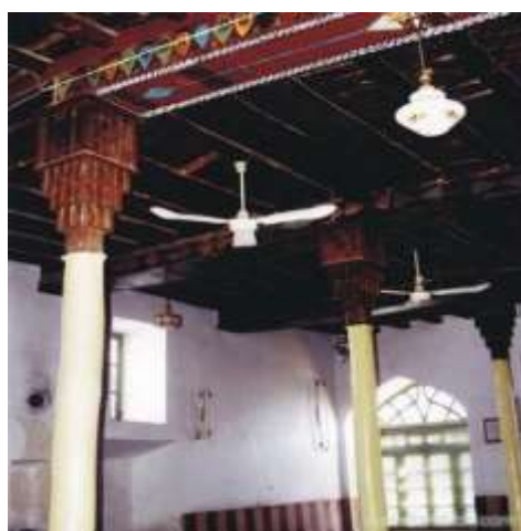
تصویر شماره 4- نمای داخلی