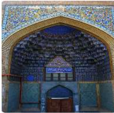
تصویر شماره 12- سردر لاجوردی مدرسه ی عباسقلی خان-مشهد