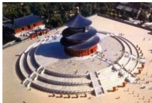
تصویر شماره 10- معبد آسمان در چین

دلیل نام بردن این بنا در این قسمت به این خاطر است که گنبد معبد آسمان آبی رنگ است و قسمت هایی از این معبد با کاشی های آبی رنگ تزئین شده است. 15