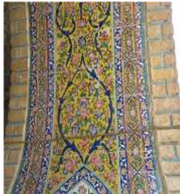
تصوی شماره 15-مسجد مشیر-شیراز