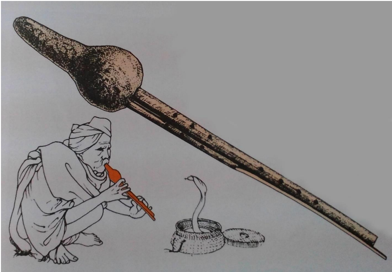
تصویر 1: نوازنده تیکتیری در حال به رقص در آوردن مار.

هندی ها موسیقی را از هنر های مقدس می دانند و موسیقی در نظر هندی ها یکی از هنرهای الهی است. آنها معتقدند که اصوات از عالم بالا الهام می شود و آوازها از طرف خدایان تصنیف می گردد که هر یک بیانگر روحيات آنها است و همین طور هر یک از هفت نت، مربوط به یک آسمان از هفت آسمان است. گروهی دیگر از هندی ها هر نت در گام هندی را سمبل صدای فریاد یکی از حیوانات می دانند، که این مورد نیز ریشه در طبیعت پرستی آنان نیز دارد. هندی ها به ساده کردن و تلخیص کردن علائم چینی پرداختند و برای هر یک از آنها، علامت ثابتی به کار بردند. آنها حتی معتقدند سازهای موسیقی مانند (Vina) و فلوت کریشنا، مبدا الهی دارند و حتی علم موسیقی هم از اکتشافات برهما است (حسنی، ۱۳۶۳).