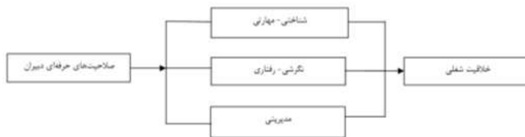
شکل ۱: مدل مفهومی پژوهش