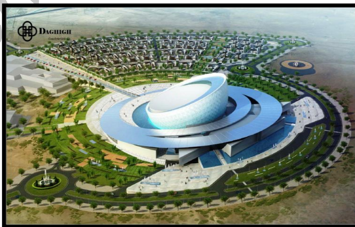
۴-۵- معیار طراحی در مرکز همایش اصفهان:

همان طور که می دانید اصفهان را از قدیم به لقب نصف جهان می شناسن و دلیل این لقب و شهرت به دلیل وجود بیش از شش هزار اثر تاریخی با قدمت صدها و هزاران سال در کنار مناطق بکر طبیعی می باشد.