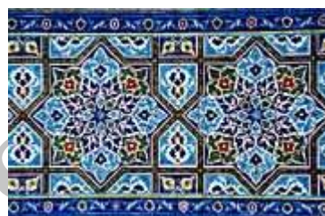
شکل (2) کاشیکاری گنبد مسجد جامع کبیر یزد