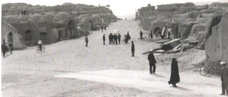
شروع خیابان کشی و شهرسازی، خیابان منتظری بیرجند

آغاز تحولات در بافت های شهری به اواخر دوره قاجار برمی گردد. از نظر سبک و شیوه معماری ترکیبی از معماری غربی و ایرانی در سازمان کالبدی و فضایی شهرها بوجود آمد (رهنمایی، 1383: 50). ظهور عناصر جدیدی چون خیابان و میدان نشان دهنده تاثیر نیازهای جدید زندگی بر شکل و ساختار کالبدی شهر است. اصلی ترین راهکار مداخله در بافت شهرها، طرح های جامع تهیه شده در دهه 40 بود (وفایی فرد، 1384: 206). الگوهای برنامه ریزی غربی به صورت طرح های جامع، در غیاب الگوهای بومی، به عنوان تنها وسیله هدایت و نظارت توسعه شهری به جوامع تحمیل شد، بی آنکه با نیازهای بومی کشورها انطباق داشته باشد (مهدیزاده، 1385: 230).