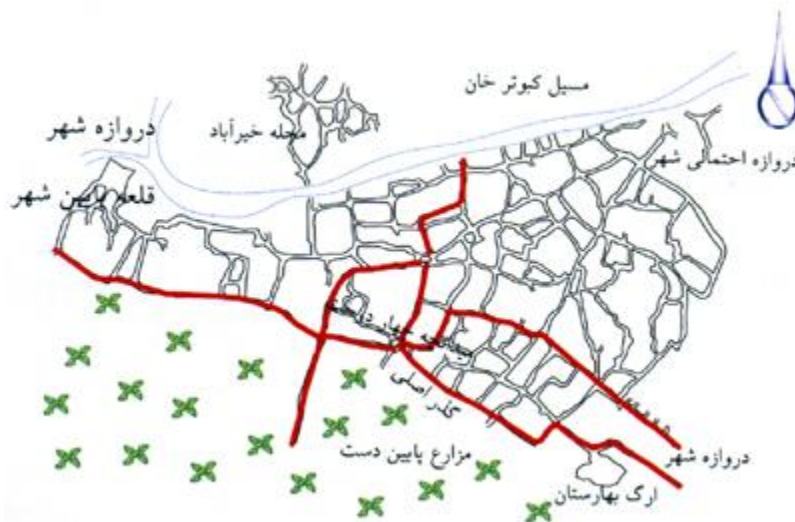
ساختار حاکم بر بافت قدیم شهر بیرجند

معماری درونگرا در بافت تاریخی بیرجند چهره ای همگن و یکدست به ساخته ها داده است. برتری جویی در آن بسیار نادر بوده و اغلب سیمایی متعادل از همه گروه های اجتماعی ارائه می کند. شکل گیری شهر مبتنی بر ساختن محلات مستقل برای رفع نیازهای معیشتی همراه با ارتباط های فرهنگی قوی بوده است. هر محله با نظامی کوچکتر و مشابه با نظام اصلی شهر عملکرد مخصوص به خود را داشته است. بافت تاریخی بیرجند در دوره قاجار شامل تعداد زیادی محله بوده است که هر محله از خدمات شهری مرسوم در آن دوره به ویژه فضاهای مذهبی برخوردار بوده است. در این بافت اندامواره کوچه های پر پیچ و خم و کم عرض بسیاری با کارکردهای برونی (دفاعی) درونی (محرومیت) و اقلیمی دیده می شود. طول دیوارها، تکرار بن بست ها و آهنگ تکرار سر در خانه ها سیمای متنوعی به راه داده است. حدود یک قرن پیش مسیر آب انبارها و نقاط تاریک در این کوچه ها با چراغ های روغنی روشن می شده، همه گذرها سنگ فرش بوده است. شهر قدیمی در اواخر قرن 13 دارای تقسیم بندی جالبی مبتنی بر سلسله مراتب بوده و بر اساس مسیر سیلاب به دو قسمت بالا و پایین شهر تقسیم می شده است که هر کدام نیز به تعداد زیادی زیر محله تقسیم شده بوده است (وفایی فرد، 1384: 206-202).