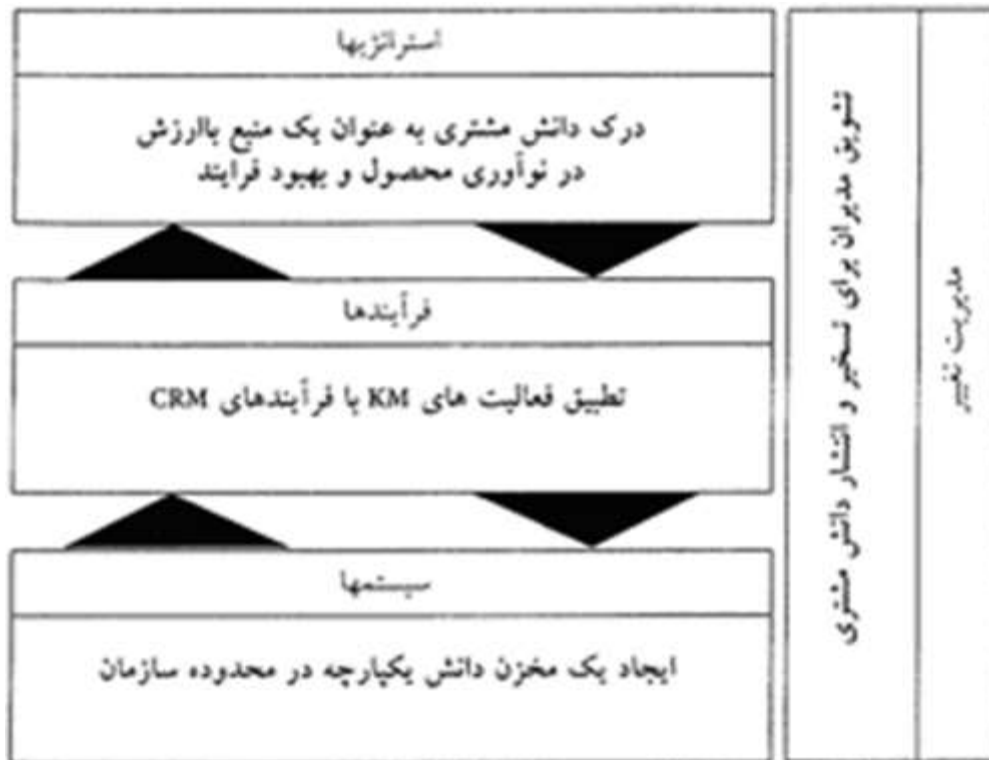
شکل ۲- چارچوب پیشنهادی برای پیاده سازی CRM مبتنی بر دانش