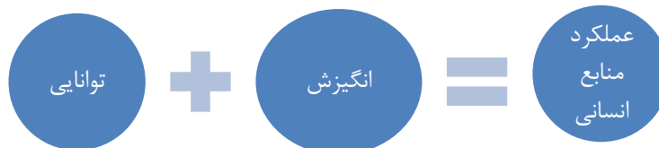
نمودار (۴) منابع انسانی