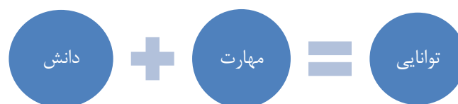
نمودار (۵) توانایی