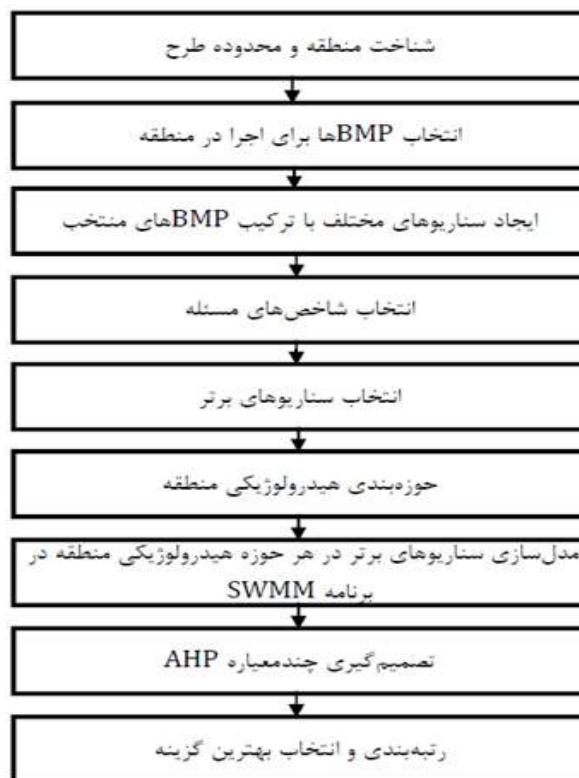
شکل ۲- فلوجارت روش تحقیق

مسئله شناسایی شده‌اند. این شاخص‌ها عبارت‌اند از: شاخص کاهش دبی پیک، شاخص بهبود کیفیت رواناب، شاخص هزینه اجرا، شاخص هزینه نگهداشت، شاخص ارتقا فرهنگ، شاخص ارتقا زیبایی و شاخص سهولت اجرا. بر اساس این شاخص‌ها گزینه‌هایی که موجب بدتر شدن وضعیت در یکی از شاخص‌های ارتقا فرهنگ و زیبایی و یا با سهولت اجرا پایین‌تر از حد متوسط بوده‌اند کنار گذاشته شده‌اند و سناریوهای برتر بر این اساس انتخاب شده‌اند. در ادامه با استفاده از مدل تصمیم‌گیری چندمعیاره AHP رتبه هر گزینه به دست آمد و بهترین گزینه مشخص شد. در شکل ۲ فلوجارت روش تحقیق نشان داده شده است.