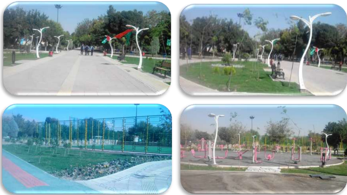
شکل ۱. بوستان ولیعصر شهرقدس