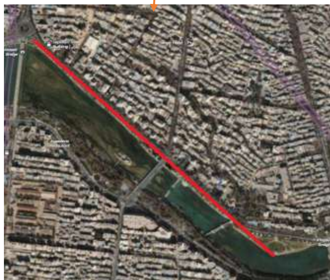
شکل (1): موقعیت مکان مورد مطالعه در شهر اصفهان