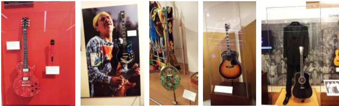
شکل ۳ تا ۱۵- موزه ادوات موسیقی فونیکس