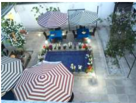
شکل ۲۶- حیاط موزه موسیقی اصفهان

در محله ارمنی ها اگر قدم بزنی حس هنر تو را فرا می گیرد، حسی که گویا آرامنه ۴۰۰ سال پیش با کوله بارهای خود به اینجا آورده اند. بیشتر که بگردی می بینی فضا به شدت ایرانی- ارمنی است. یک نماد بارز آمیختگی هنر دو سرزمین، گنبد‌های ایرانی کلیسای وانگ است که در کنار گنبد ارمنی ناقوس جا خوش کرده است و بیانگر این همنشینی ناخواسته اهالی محل با ایرانیان است. سال های سال هنر ایرانی در این محله خودش را از طریق معماری به ما نشان می داد اما این روزها جای دنجی می شناسم که آوازه هنر کهن این سرزمین را در همین محله به گوش می رساند. از خیابان توحید که وارد خیابان شهید قندی یا همان مهرداد سابق می شوی کفایت کمی جلو بروی و سمت راست خود را نگاه کنی. یک تابلوی ساده که روی آن نوشته موزه موسیقی اصفهان (۱۰) از در که وارد می شوی یک حیاط کوچک با یک حوض آبی و باغچه های قشنگ به تو هشدار می دهد که به فضای هنری، پر از حس آرامش های زمان کودکی وارد شده ای. باید دغدغه ها را کنار بگذاری و خودت را رها کنی تا انرژی های خوب وجودت را پر کند. (۱۰)