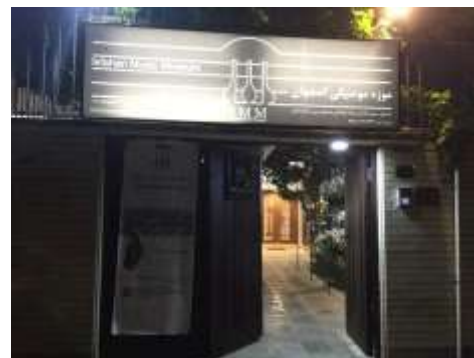
شکل ۲۵- نمای ورودی موزه موسیقی اصفهان