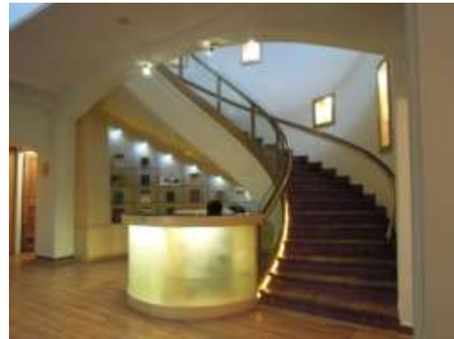
شکل ۱۹- لابی، میز اطلاعات و پلکان که با الهام از کلید سل طراحی شده شکل ۲۰- سالن سازهای کوبه ای