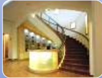
سیرکولاسیون : عمدتاً به صورت راهرویی و بعضاً همراه با فضای تقسیم مرکزی

که سیرکولاسیون حرکت و منظر زیبایی برای بازدیدکنندگان بوجود آورده و موجب جذابیت افزون تری برای بازدید کنندگان از موزه شده است. در موزه موسیقی اصفهان این تغییر در فضای حیاط صورت گرفته، جاذبه ی غالب در این موزه، در دسترس بودن سازها و پخش موسیقی زنده در فضاهای اصلی آن است.