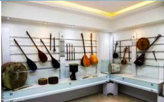
شکل ۳۰- سازهای زهی موزه موسیقی