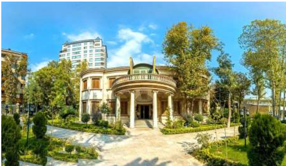
شکل ۱۶- موزه موسیقی ایران

شده. از ۵ پله ۱۵ سانتی که بالا بیایی دو مجسمه گپی با سرنا و دهل به استقبال می آیند. انعکاس صدا را در سقف منحنی بالاسر می بینی. سقفی که شبیه کاسه ساز طراحی شده و پنج میلخ مسی رنگ از وسط آن می گذرد. با اینکه ساختمان معماری غربی دارد، ولی ورود به ساختمان شبیه سفر به دل سازهاست. مثلاً سالن سازهای کوبه ای شبیه دف و دایره و طبل و دهل گرد است. به سالن سازهای بادی که بروید انگار پا به سینه نی هفت بندی تو خالی گذشته اید و روی سقف هم سوراخ های نی تعبیه شده است. میانه سالن اصلی نیز اثری انتزاعی ایستاده که تعدادی سیم را از زمین به سمت بالاترین نقطه سقف موزه می برد. از طبقه سوم که به این اثر نگاه کنید سازی می بینید که نواهای آسمانی را به زمین می رساند. (۳)