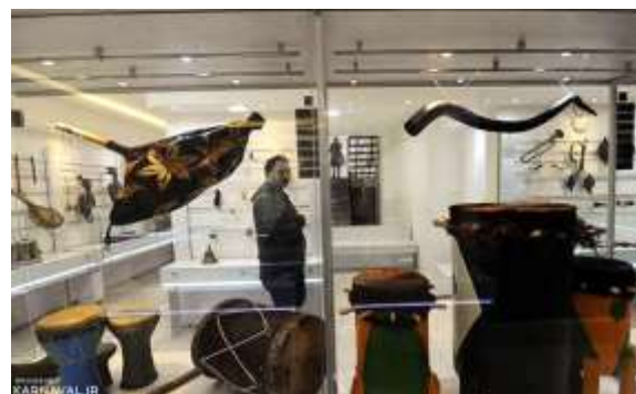
شکل ۲۷- سازهای کوبه ای موزه موسیقی