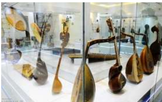
شکل ۲۸- سازهای زهی موزه موسیقی