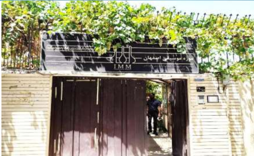
شکل ۱۷- موزه موسیقی اصفهان