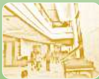
کانسپت معماری : عمدتاً فاقد کانسپت فرمی و همراه با ایده های متداول چیدمان در فضاهای سالن و گالری موزه و نمایشگاه

نمودار ۱- خصوصیات کلی سیرکولاسیون، دید و منظر و کانسپت معماری در موزه موسیقی ایران و اصفهان