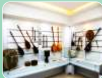
دید و منظر : عمدتاً منظرهای کنج دار با نمای قفسه های ردیفی و شبکه ای