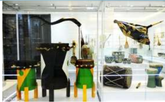
شکل ۲۹- سازهای کوبه ای موزه موسیقی