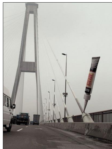
تصویر ۵، استفاده گرافیک محیطی جهت تبلیغات

سلیقه شهروندان یک شهر را بفهمیم می‌بایست به گرافیک محیطی در شهر توجه کنیم و ببینیم که چگونه از گرافیک محیطی بهره‌جسته‌اند (غفاری نمین، ۱۳۹۰).