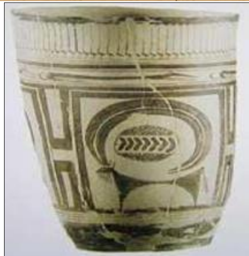
تصویر ۱، تزئین خطوط هندسی و حیوانی بر روی سفال شوش

تا پیش از اختراع چرخ سفالگری در آغاز هزاره چهارم قبل از میلاد تمامی سفالینه‌های مکشوفه از مناطق باستانی بدون استثنا دست ساز هستند و با حرارت کم (۴۰۰ تا ۷۰۰ درجه) پخته شده و سبک و پوک هستند و ماده چسباننده اغلب آنها کاه و سبزی خرد شده است. و معمولاً به دو شکل ساده و منقوش موجودند. سفالینه‌های (تپه سبز) دهلران که قدمت آنها به حدود ۵۵۰۰ تا ۵۰۰۰ سال قبل از میلاد می‌رسد حکایت از پخت آنها در کوره‌های ابتدایی دارد. اختراع چرخ سفالگری در آغاز هزاره چهارم قبل از میلاد در نقاط مختلف باعث تولید انبوه انواع ظروف و ابزار سفالینه شد. سفالینه‌های شوش I و سیلک III کاشان در آغاز هزاره چهارم قبل از میلاد با چرخ سفالگری ساخته شده‌اند. سفالینه‌های پیش از تاریخ نه تنها به عنوان یکی از ضروریات زندگی روزمره اهمیت داشته‌اند، بلکه نوعی شیء تزئینی نیز محسوب می‌شده‌اند. بیشتر سفالینه‌هایی که از درون قبور و محوطه‌های باستانی بدست آمده‌اند، کاملاً سالم و مصرف نشده‌اند (علی‌یاری، ۱۳۸۴). در آغاز هزاره چهارم سفالهای مکشوفه از سیلک، و همچنین برخی از محوطه‌های باستانی جنوب و جنوب غربی ایران در شوش، چغامیش و تل باکون حکایت از ساخت سفال با چرخ را دارد. (تصویر ۱) در همین دوره تحولی در ترسیم نقوش نیز بوجود آمده است و سفالینه‌ها علاوه بر نقوش هندسی با نقوش مشبک شده نباتی، حیوانی و انسانی نیز آرایش و تزئین می‌شده‌اند. طی هزاره چهارم تا اوایل هزاره اول تولید سفال در تمامی نقاط ایران به عنوان مهم‌ترین تولید محلی و منطقه‌ای با رشدی چشمگیر همراه بوده است. (کوبان، سیما، ۱۳۵۴).