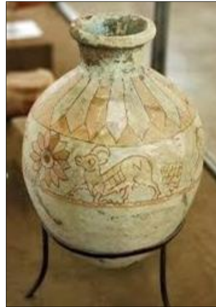
تصویر ۳، نقش قوچ بر روی سفال شوش