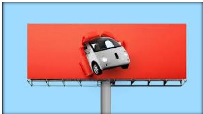
تصویر ۷، خلاقیت در گرافیک محیطی

آسان‌تر پایداری حاصل شود، چه از نظر اقتصادی و چه اجتماعی و زیست محیطی. بررسی شکل‌های شهر از این دید که پاسخگوی معیارهای پذیرفته شده پایداری باشد حاکی از آن است که هم ساختار خرد و هم ساختار کلان شهر نقش مهمی دارند. ساختار اول دسترسی به خدمات و تسهیلات و مراکز حمل و نقل را تامین می‌کند. ساختار دوم کیفیت زیست محیطی مناطق شهری و دسترسی به فضاهای باز و مناطق روستایی را تحت تاثیر قرار می‌دهد (برندفری، ۱۳۷۶).